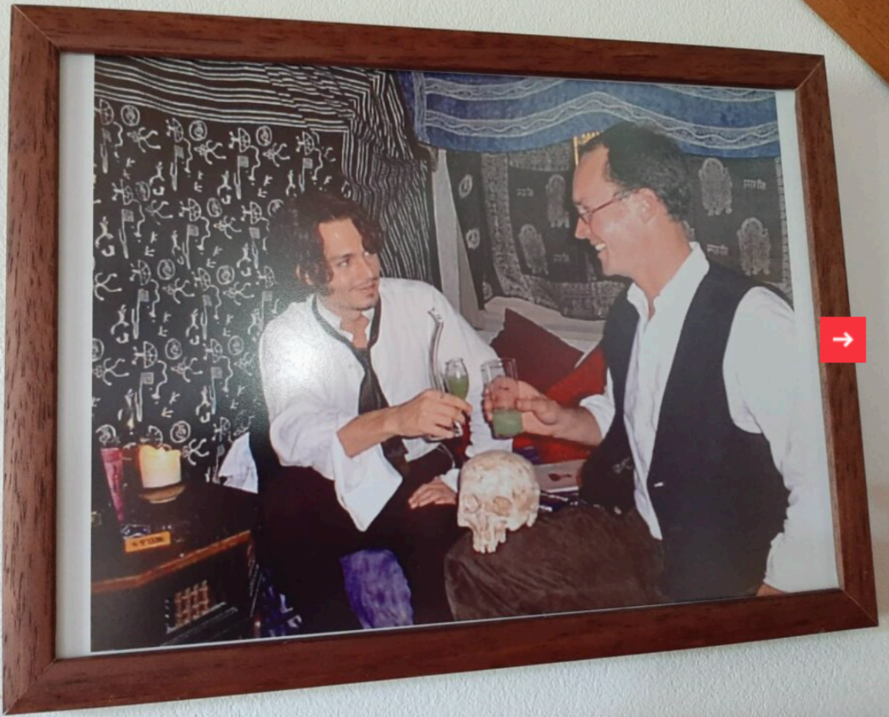
Johnny Depp natáčel v roce 2000 v České republice film Z pekla.